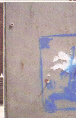
Stenciling, dat doe je zo.