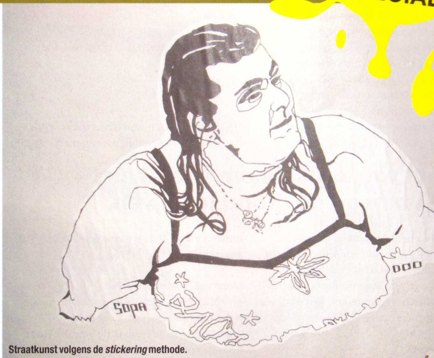
Straatkunst volgens de stickering methode.