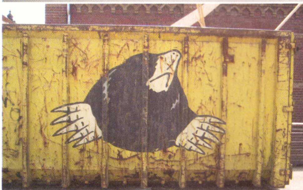
Ook containers zijn geliefd bij straatkunstenaars.